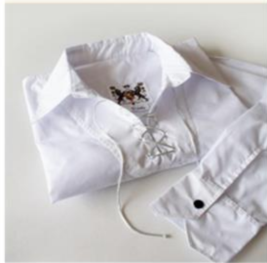
Vestuario estudiantina general