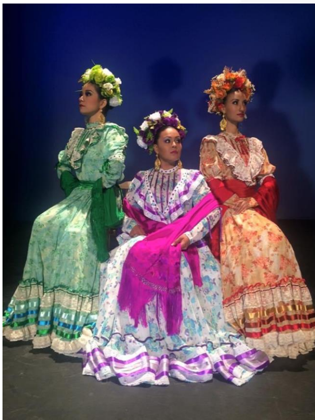
Rebozos de seda de Santa María SLP