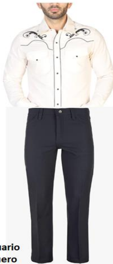
Vestuario vaquero rondalla