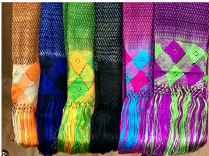
Faldilla o fondo