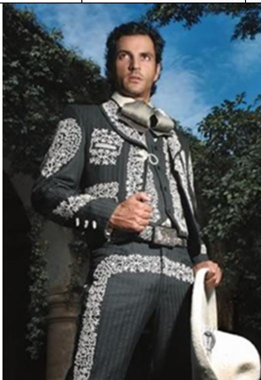
Especificaciones para cinturones (Ballet Folclórico Guadalajara)